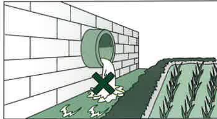
暗きよ排水が農作物の用水路に流入するような所では使用をさけてください。