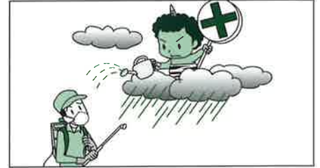
散布後に異常豪雨があると周辺の作物に葉害を起す場合がありますので、このような場合は散布を見合わせてください。