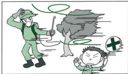
風の強い日は散布液が空中に飛散して周辺の樹や作物に葉害を起す恐れがあるので、使用しないでください。