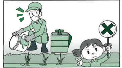
有用樹木や有用作物、とくに水田の近くでは散布器具を洗わないでください。