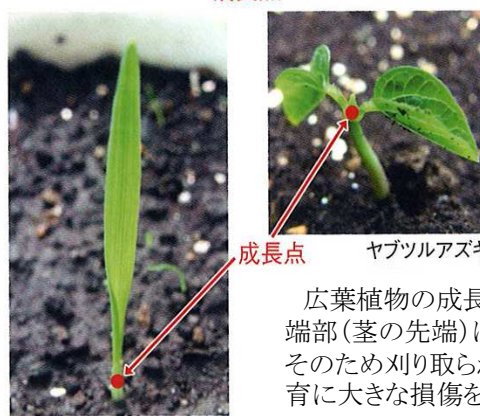
成長点 ヤブツルアズキ