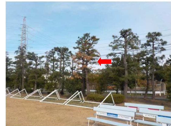
葉が黄変したマツ(富山県草島)