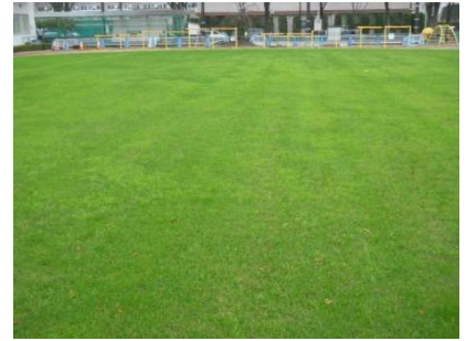
寒地型芝草で冬も緑色の芝生

除草剤、殺虫剤、殺菌剤すべてに共通して言えることですが、ある薬剤に対して抵抗性のある個体(その薬剤が効かない個体)は自然界に一定数存在します。同じ薬剤を使い続けると、この抵抗性個体だけが生き残り、その子孫が増殖することで、やがてその剤が全く効かなくなるという現象が起きます。このような事態を避けるためには、系統の違う薬剤をローテーションで使用することが大切です。今回は、除草剤の作用機作と系統についてご紹介します。